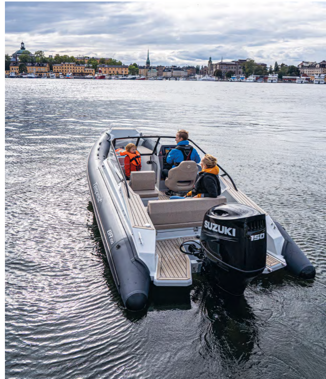
Obs! Båtens färgsättning på bilden motsvarar inte den som erbjuds.