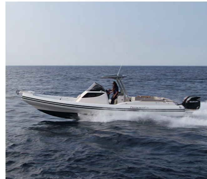
Obs! Båtens färgsättning på bilden motsvarar inte den som erbjuds.

TEKNISKA DATA Längd: 1055 cm | Bredd: 328 cm | Max motorstorlek: 2 x 300 hk | Max antal personer: 18 | Vikt: 3 000 kg