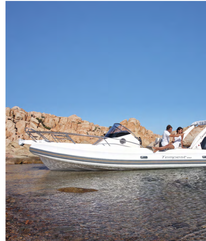
Obs! Båtens färgsättning på bilden motsvarar inte den som erbjuds.

TEKNISKA DATA Längd: 791 cm | Bredd: 305 cm | Max motorstorlek: 300 hk | Max antal personer: 18 | Vikt: 1 500 kg