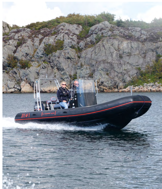
Obs! Båtens färgsättning på bilden motsvarar inte den som erbjuds.

TEKNISKA DATA Längd: 650 cm | Bredd: 252 cm | Max motorstorlek: 200 hk | Max antal personer: 10 | Vikt: 1 000 kg