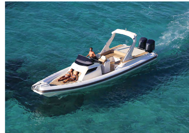
Obs! Båtens färgsättning på bilden motsvarar inte den som erbjuds.

TEKNISKA DATA Längd: 1197 cm | Bredd: 354 cm | Max motorstorlek: 2 x 350 hk | Max antal personer: 18 | Vikt: 3 400 kg