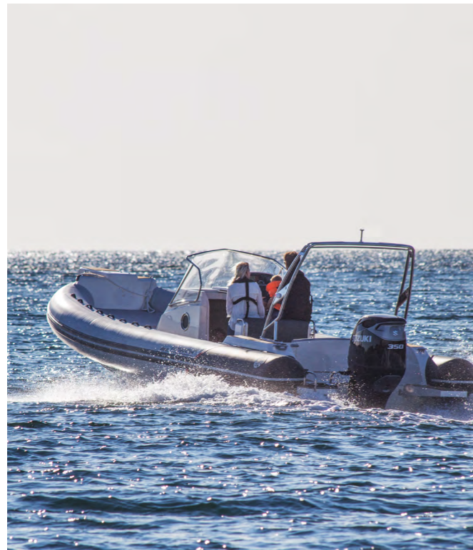
Obs! Båtens färgsättning på bilden motsvarar inte den som erbjuds.

TEKNISKA DATA Längd: 885 cm | Bredd: 328 cm | Max motorstorlek: 2 x 200 hk | Max antal personer: 16 | Vikt: 2 000 kg