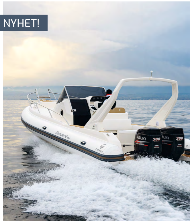
Obs! Båtens färgsättning på bilden motsvarar inte den som erbjuds.