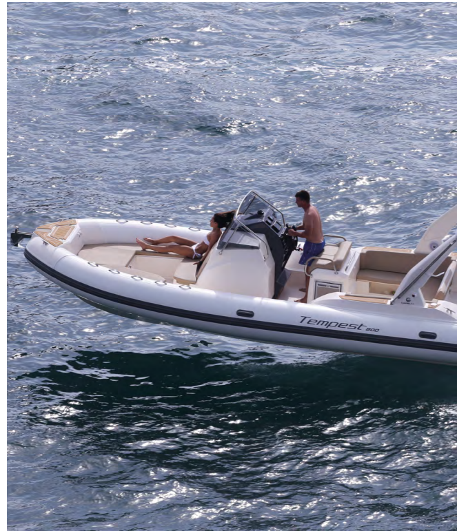
Obs! Båtens färgsättning på bilden motsvarar inte den som erbjuds.