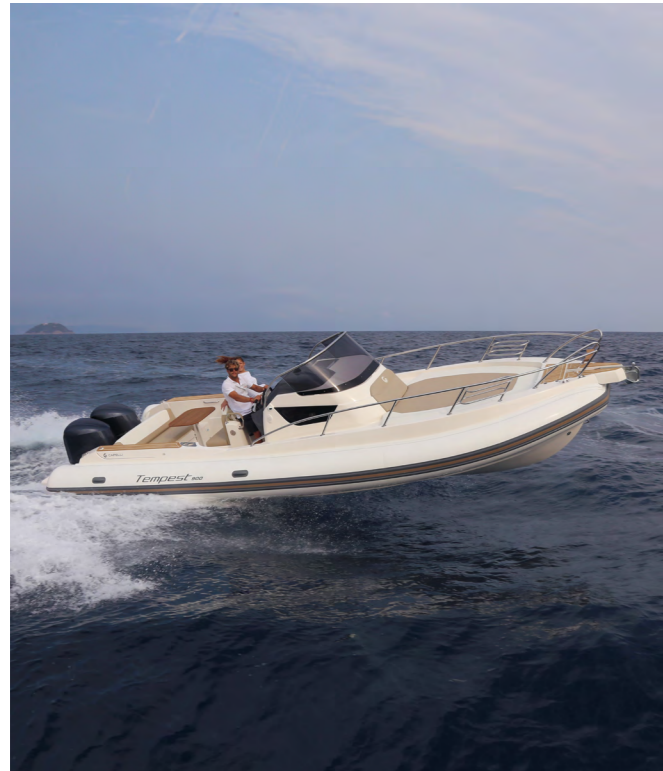
Obs! Båtens färgsättning på bilden motsvarar inte den som erbjuds.