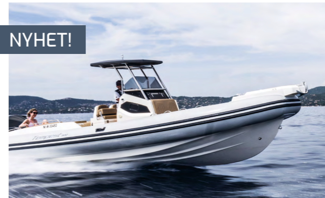
Obs! Båtens färgsättning på bilden motsvarar inte den som erbjuds.

TEKNISKA DATA Längd: 850 cm | Bredd: 325 cm | Max motorstorlek: 2 x 200 hk | Max antal personer: 16 | Vikt: 1 900 kg